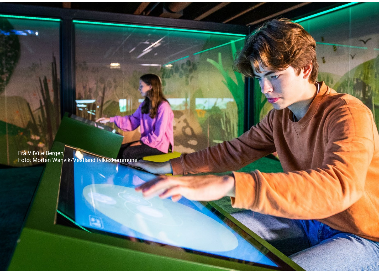
Frå VilVite Bergen