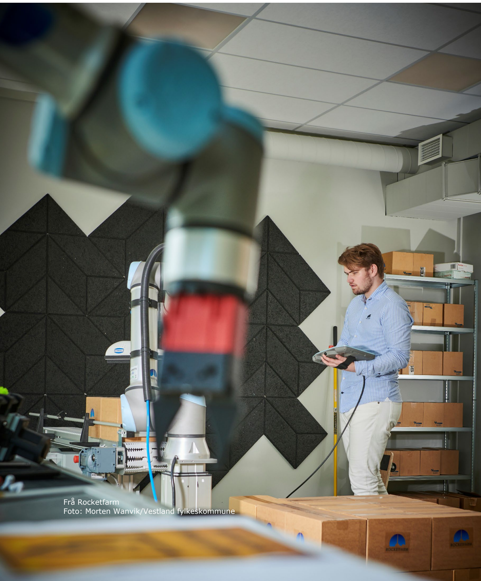
Frå Rocketfarm