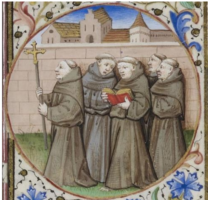
Bildet viser fransiskanermunker i en prosesjon i sine typiske grå drakter.

Frans var sønn av en rik italiensk kjøpmann som valgte et liv i frivillig fattigdom. Hans omsorg for de fattige inspirerte mange andre og førte til grunnleggelsen av ordenen.