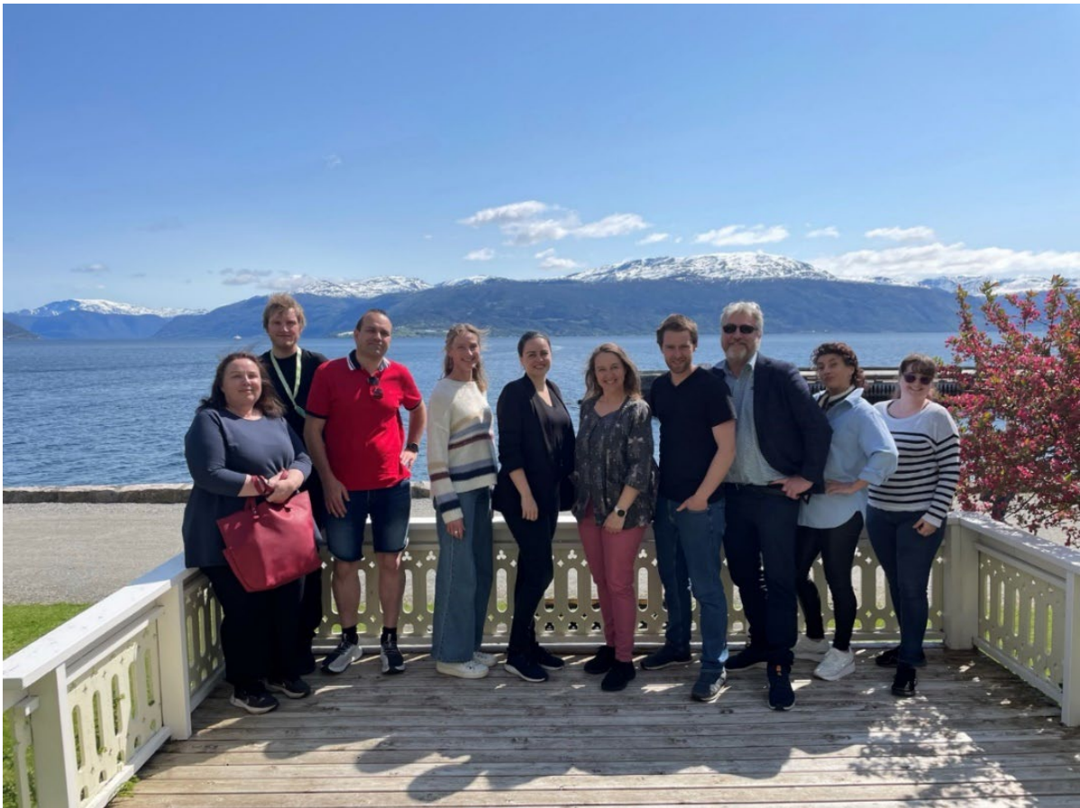
1Dei tilsette ved KAV på Kontaktkonferansen i Balestrand 2023.

Alle som jobbar for KAV er fast tilsett i Vestland fylkeskommune. Gjennom gjeldande tenesteavtale disponerer KAV desse stillingsressursane.