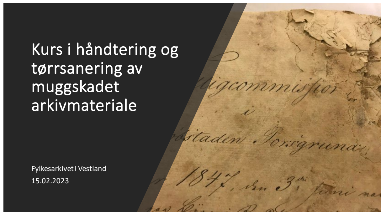
Illustrasjon frå IKA Kongsberg sin presentasjon for KAV.