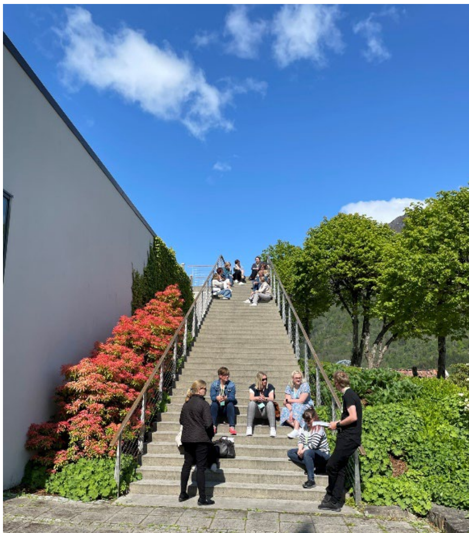
Eit av gruppearbeida på Kontaktkonferansen 2023, Kviknes hotell i Balestrand.

Arrangement er viktige møteplassar som danner grunnlag for fagleg dialog, utvikling og nettverksbygging. Vi har faste arrangement for medlemskommunane våre, og deltek ofte som arrangør av andre arrangement.