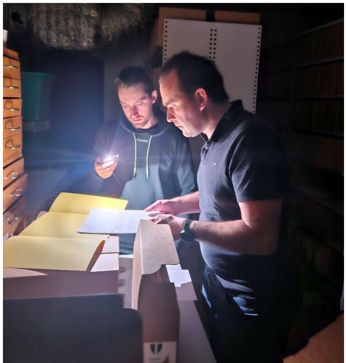
Straumbrot stansa ikkje synfaringa av arkiva.