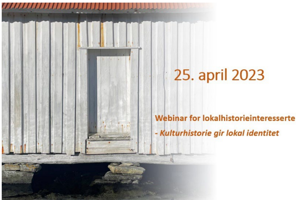
Digital plakat for arrangementet. Vestland fylkeskommune.

Lokalhistorisk webinar er eit samarbeid mellom seksjonane for Kulturarv, Bibliotekutvikling og Arkiv, i avdeling for Kultur og folkehelse i Vestland fylkeskommune. Arbeidsgruppa bestod av seks personar, og er ein del av samarbeidet internt på seksjon Arkiv, men og som ein del av målsetninga om arbeid på tvers av seksjonar/avdelingar i organisasjonen