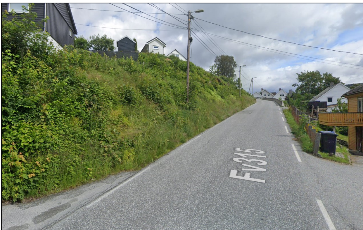
Figur 6: Etablering av fortausløsning vil krevje høg mur mot busetnad. Stad: FV5402 S1D1 m2100.