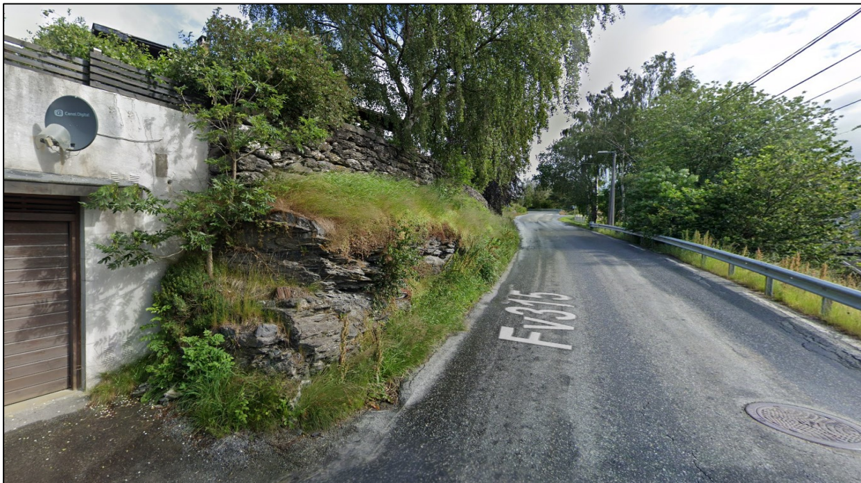
Figur 5: Garasje og mur tett på fylkesvegen. Etablering av fortausløsning vil krevje høg mur. Stad: FV5402 S1D1 m2333.