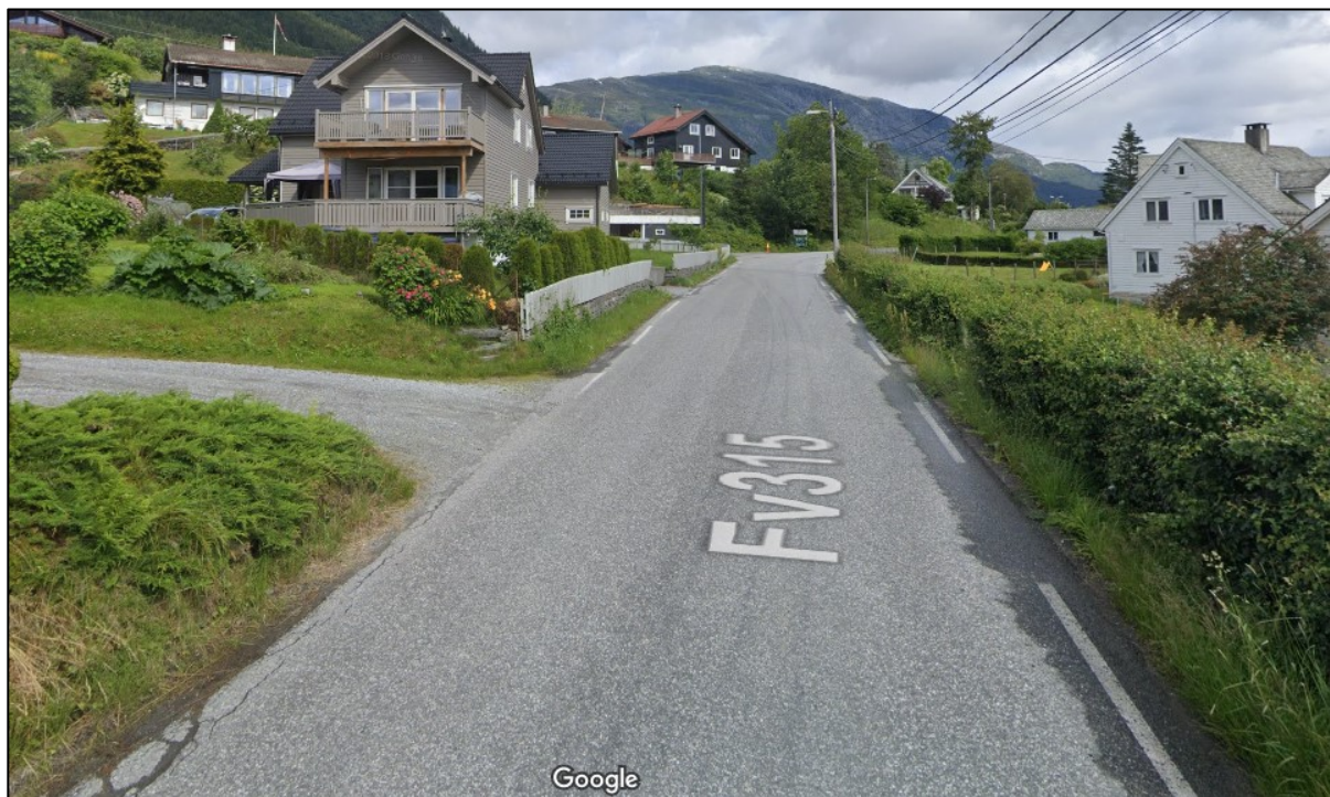
Figur 3: Private avkøyrslar og konstruksjonar tett på vegbana. Stad: FV5402 S1D1 m1951.