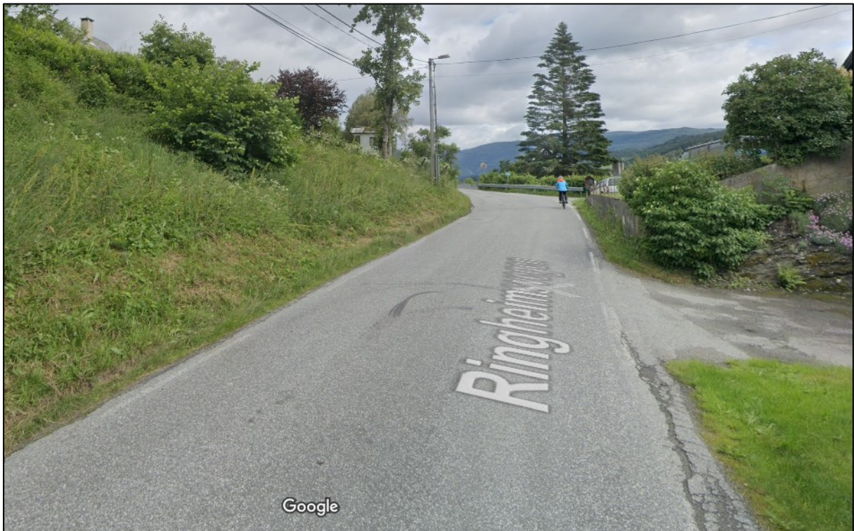
Figur 1: Smal vegbane, private avkøyrsler og dårleg sikt i kurve. Stad: FV5402 S1D1 m1854.